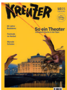
Illustration: www.superfreunde.eu Gestaltung: Chris Schneider